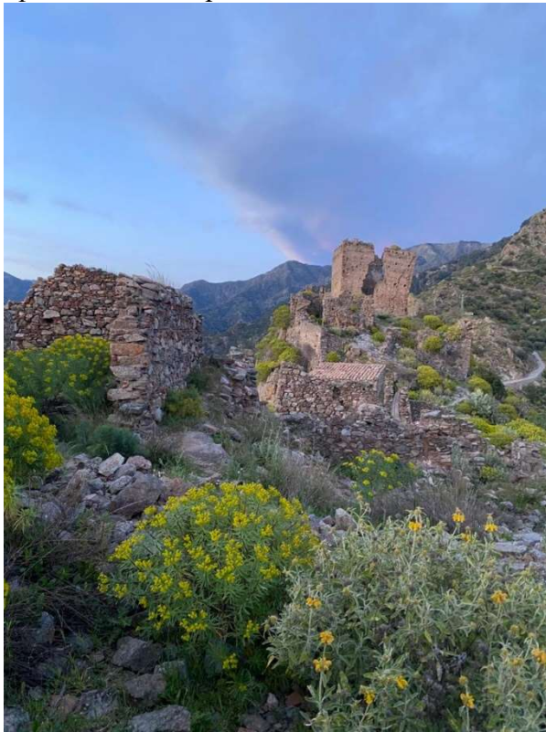
Oleo-Euphorbietum dendroidis presso i ruderi del Castello di Amendolea

Proseguendo verso il castello, lungo il sentiero sarà, inoltre, possibile osservare alcune specie di orchidee selvatiche, tra cui, in questo periodo, la Barlia robertiana (Loisel.) Greuter, mentre diffuse sono le praterie steppiche mediterranee, conseguenti i frequenti incendi, con Hyparrhenia hirta (L.) Stapf dell'associazione Hyparrenietum hirta-pubescentis frequente in tutta la vallata dell'Amendolea.