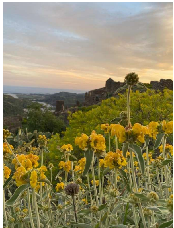
Phlomis fruticosa L.

Sulle rupi sotto il castello, ma anche su quelle che fiancheggiano la provinciale fino a Ponte Lapsè si localizzano diverse specie casmofile, spesso endemiche, tra cui Dianthus virgineus L., Centaurea pentadactyli Brullo, Scelsi & Spamp., Silene calabra Brullo, Scelsi & Spamp., Crepis aspromontana Brullo, Scelsi & Spamp. e Allium pentadactyli Brullo, Pavone & Spamp. che caratterizzano il Centaureo-Dianthetum longicaulis , associazione degli Asplenietalia glandulosi . Sulle rupi interessate invece da stillicidio di acqua ricche in carbonati è presente Adiantum capillus-veneris L.,