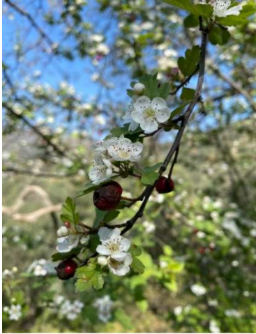
Crataegus monogyna Jacq.