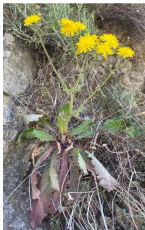
Crepis aspromontana Brullo, Scelsi & Spamp.