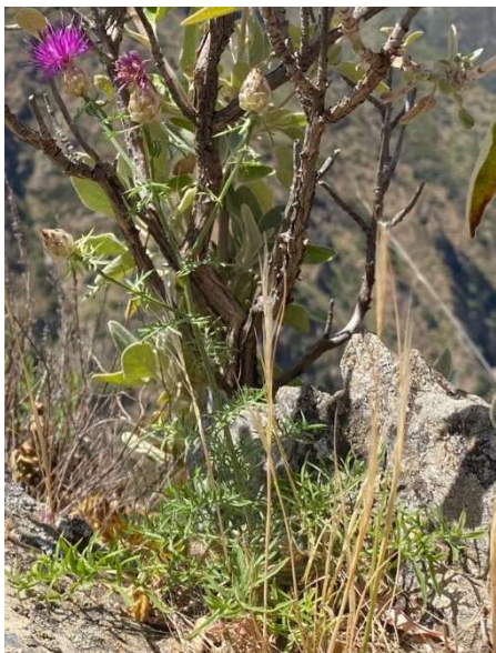
Centaurea pentadactyli Brullo, Scelsi & Spamp.