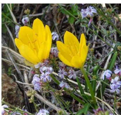
Sternbergia lutea (L.) Ker Gawl. ex Spreng. e Plumbago europaea L.

Glebionis discolor (d'Urv.) E.Cano, Musarella, Cano-Ortiz, Piñar Fuentes, Spamp. & Pinto Gomes Helichrysum italicum (Roth) G.Don subsp. italicum Hypochaeris achyrophorus L. Hypochaeris laevigata (L.) Ces., Pass. & Gibelli Lactuca viminea (L.) J.Presl & C.Presl subsp. viminea Leontodon tuberosus L. Onopordum illyricum L. subsp. illyricum Phagnalon saxatile (L.) Cass. Pulicaria odora (L.) Rchb. Reichardia picroides (L.) Roth Sonchus asper (L.) Hill subsp. asper Sonchus oleraceus L.