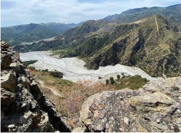
Vista della Fiumara Amendolea dal Castello di Amendolea

L'escursione si svolgerà presso la vallata della Fiumara Amendolea. L'itinerario prevede diverse tappe lungo il sentiero che, dall'area circostante Ponte Lapsè, porterà fino al Castello Ruffo di Amendolea. Vicino al luogo dell'appuntamento sarà possibile osservare anche alcuni lembi degradati di bosco a quercia castagnara e olivastro ( Quercus virgiliana (Ten.) Ten. e Olea europaea L.) riferibili all'associazione Oleo-Quercetum virgiliana . Nella fiumara sottostante sono presenti cespuglieti ripariali a salici e ontano in cui è possibile osservare Salix ionica Brullo, Scelsi & Spamp. una specie endemica delle fiumare del versante ionico dell'Aspromonte.