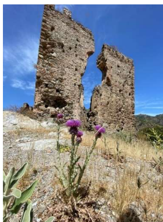
Onopordum illyricum L. subsp. illyricum

Sternbergia lutea (L.) Ker Gawl. ex Spreng.