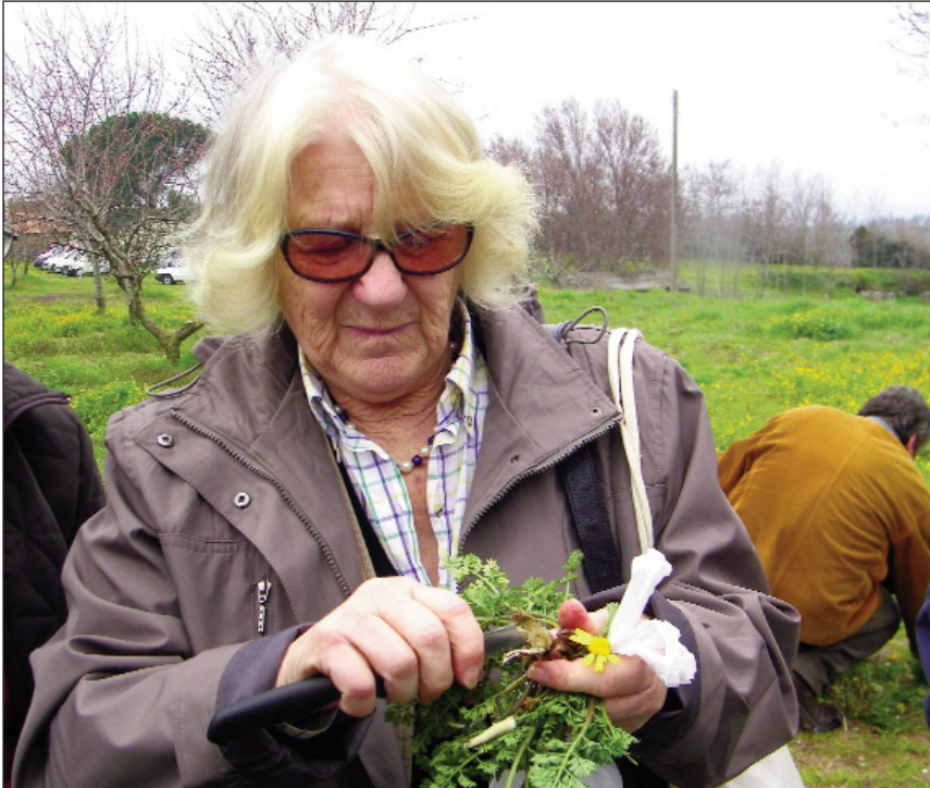
Fig. 3. Edda docente del 2° corso “Buone da mangiare” tenuto all’Orto Botanico di Viterbo nel 2010.