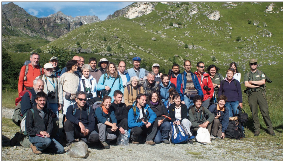
Fig. 1. Partecipanti all'escursione del Gruppo di Floristica, Sistematica ed Evoluzione (SBI) nella Valle Po, luglio 2014.